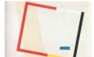
Friedrich Vordemberge-Gildewart Composition Nr. 71